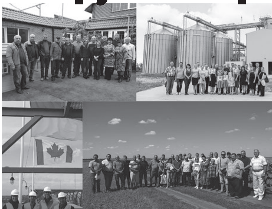
У 2020-му виповнюється 27 років з початку відродження в Україні обслуговуючої кооперації

ОДНАК в Україні є приклади, які перекреслюють всі ці аргументи, крім одного - кооперативному руху потрібна потужна фінансова підтримка з боку держави або якихось інших джерел. Йдеться про двох обслуговуючих кооперативах, створених за фінансової підтримки уряду Канади: «ЗЕРНО-Бунка» в Бобринецькому районі Кіровоградської області та «Зерновий» в Васильківському районі Дніпропетровської області. Фермери не гаяли часу даремно, а розвивали свої об'єднання. Спочатку з них зараз входять 34 фермерських господарства, в другій - 92, всі разом обробляють близько 50 тисяч гектарів угідь. У Васильівці побудована перша черга кооперативного елеватора ємністю 12 700 т і завершується будівниц-